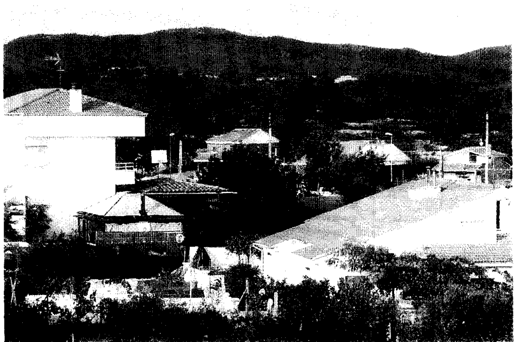
El nou complex per a gent gran se situarà a la urbanització Brises del Mar.

L'Altafulla Life Resort, el segon complex a l'Estat espanyol que té unes dimensions tan grans després del de Santa Pola, Alacant, comptarà amb una inversió inicial d'entre 80 i 100 milions d'euros. Tindrà l'aspecte d'un poble mediterrani i s'hi instal·laran restaurants, un centre comercial, un teatre, un spa, un supermer-